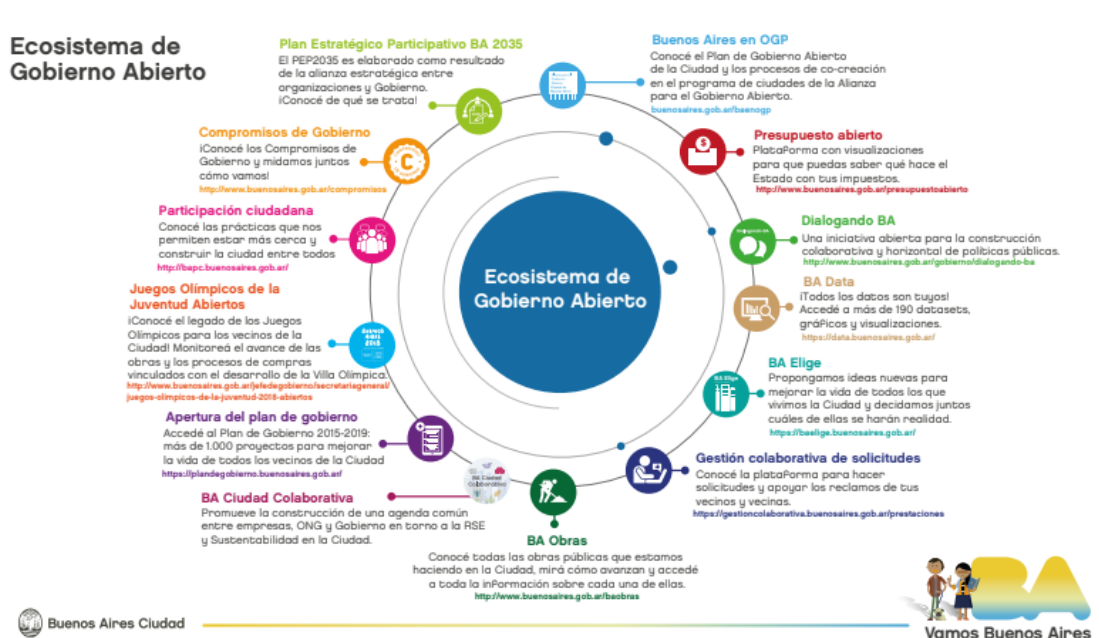
Esquema 2: ecosistema de gobierno abierto