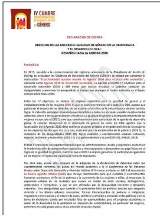
Declaración de Cuenca IV Cumbre Iberoamericana de Agendas Locales de Género