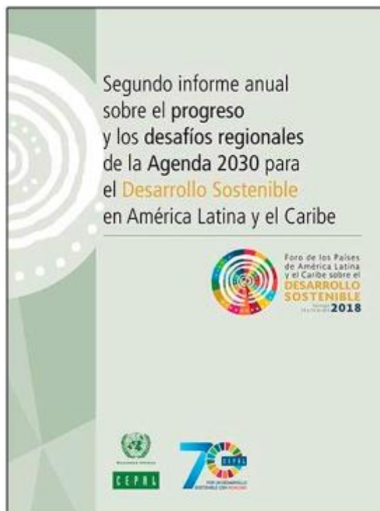
Segundo informe anual sobre el progreso y los desafíos regionales de la Agenda 2030 para el Desarrollo Sostenible en América Latina y el Caribe